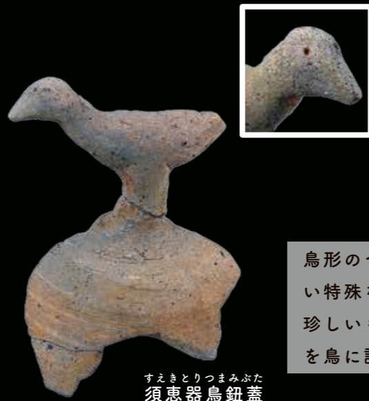
すえきとりつまみぶた 須恵器鳥鈕蓋