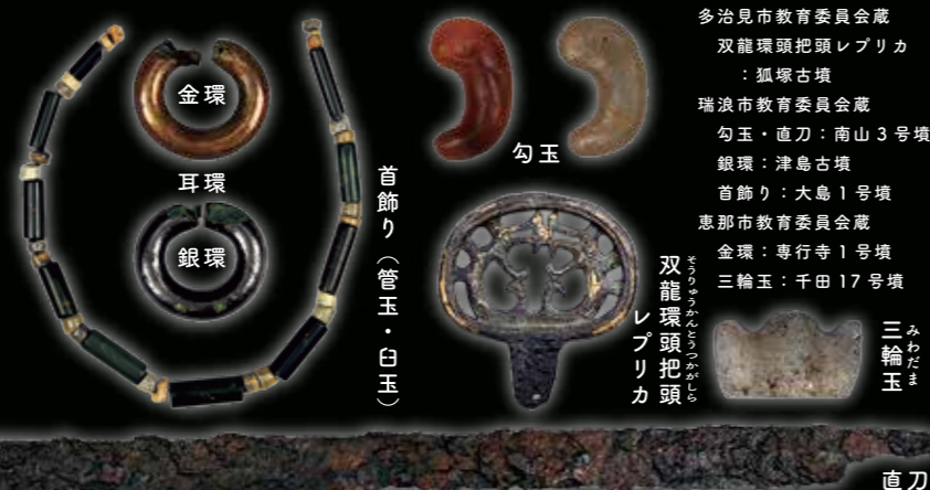
多治見市教育委員会蔵 双龍環頭把頭レプリカ ：狐塚古墳 瑞浪市教育委員会蔵 勾玉・直刀：南山3号墳 銀環：津島古墳 首飾り：大島1号墳 恵那市教育委員会蔵 金環：専行寺1号墳 三輪玉：千田17号墳 三輪玉 みわだま

古墳の副葬品には、勾玉・管玉・白玉・小玉・切子玉などの玉類、耳環（イヤリング）、武具（弓矢、剣、甲冑など）、馬具、刀子、銅鏡など様々なものがあり、須恵器や土師器も多く副葬されました。乙塚古墳の副葬品はほぼ失われていましたが、これら近隣の古墳の副葬品よりも豪華な副葬品が納められていたことでしょう。