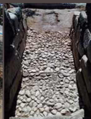
前庭部~羨道の礎床 (第9次調査)