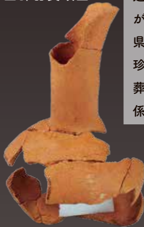
はじちちょうけいこ 土師器長頸壺

丁寧に精製された粘土で作られた土師器の長頸壺です。近畿地方の古墳などで出土が知られていますが、岐阜県内では類例がなくとても珍しい発見といえます。被葬者と近畿地方との強い関係性がうかがえる遺物です。