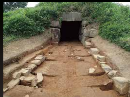
発掘調査後 (第8次調査)

横穴式石室 全長 19.2m (美濃地方最大級) 両袖式、胴張、玄門立柱石、まぐさ石 礎床、排水溝、石材は主に花崗岩