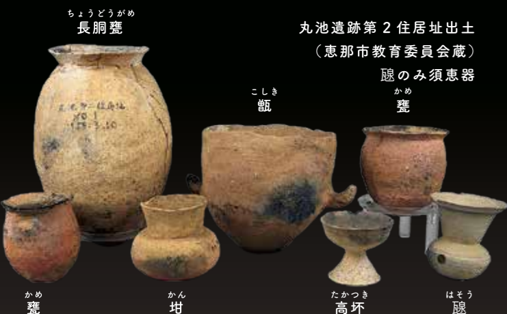
ちょうどうがめ 長胴甕 丸池遺跡第2住居址出土（恵那市教育委員会蔵） 隠のみ須恵器 甕 こしき 甑 かめ 甕 かん 罎 たかつき 高坏 はそう 甕