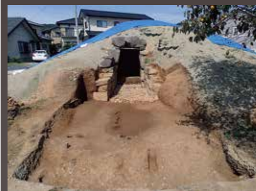
発掘調査後 (第9次調査)

横穴式石室 全長 9.5m 疑似両袖式、玄門立柱石、まぐさ石 礎床、石材は主に花崗岩