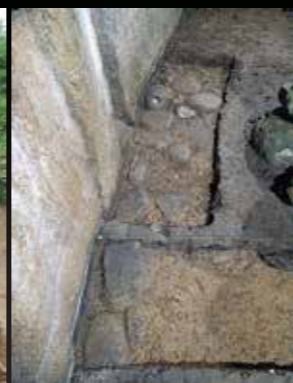
玄室の礎床 (第8次調査)