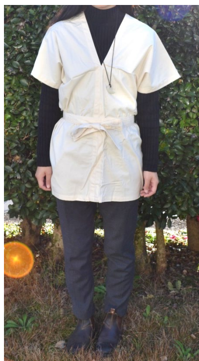
着用例 ※大人でも着られます