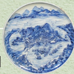
箱館焼 瑞浪市陶磁資料館蔵