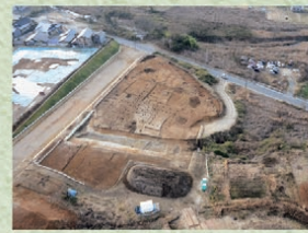
妻木平遺跡 明智氏居館跡